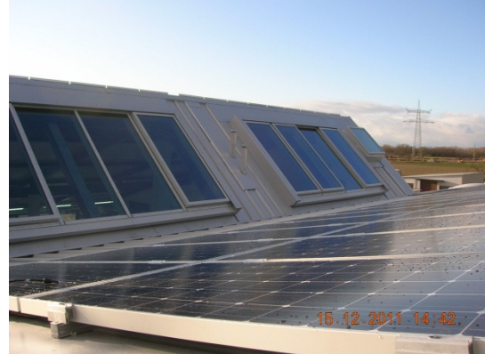
und eine Photovoltaik-Anlage.