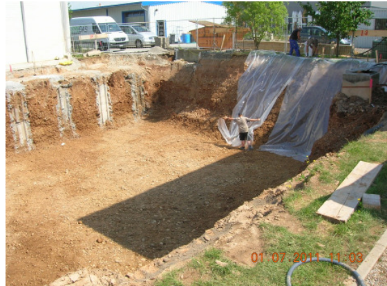
Aushub für das Fundament.