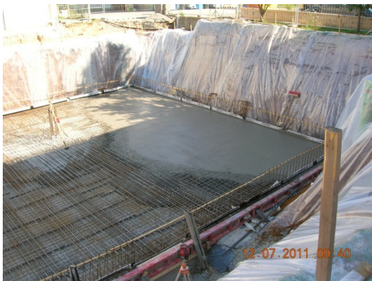
Die Bodenplatte wird betoniert...