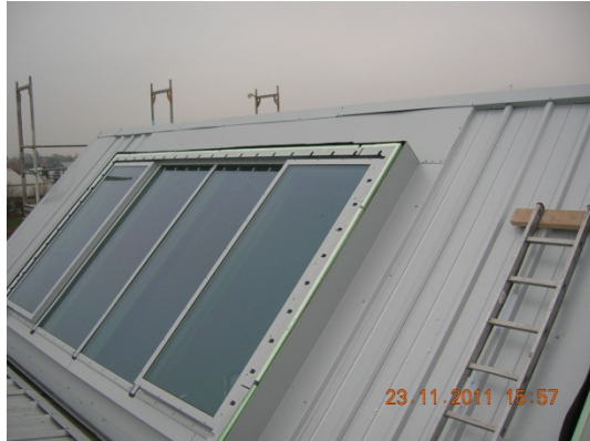
Es gibt ausreichend Licht von oben...