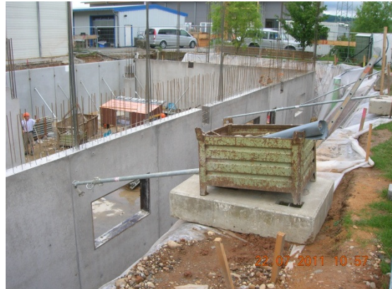
und die Kellerwände werden erstellt.