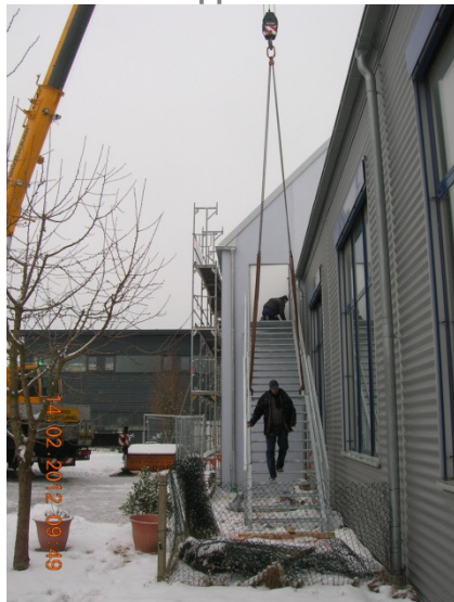
Eine Außentreppe wird montiert und...