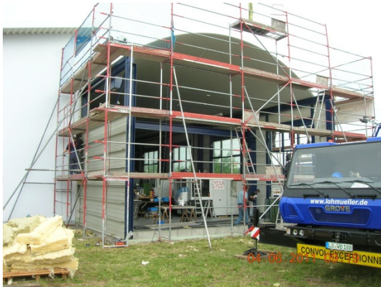
Teildemontage der Bestandshalle.