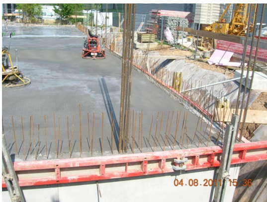
Das Kellergeschoss ist fertig.